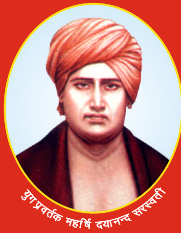
श्री प्रवर्तक महर्षि दयानन्द सरस्वती