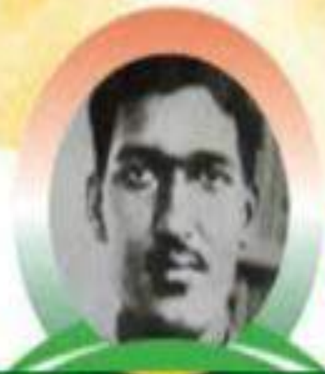
अशफाक उल्ला खान