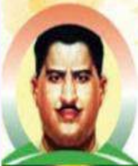
राम प्रसाद बिस्मिल