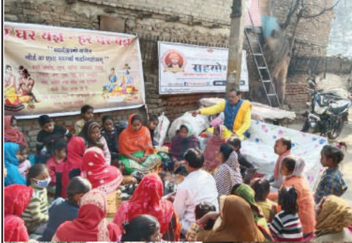
नंगली डेरी, नजफगढ़, दिल्ली

आर्य समाज मन्दिर, डी.सी.एम. रेलवे कोलोनी, निकट फिल्मस्तान, दिल्ली-110007