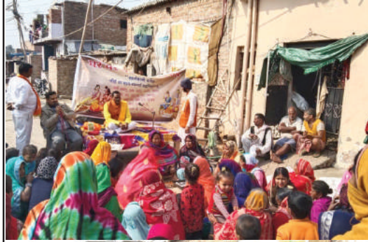
जे. जे. कॉलोनी, मायापुरी, नई दिल्ली