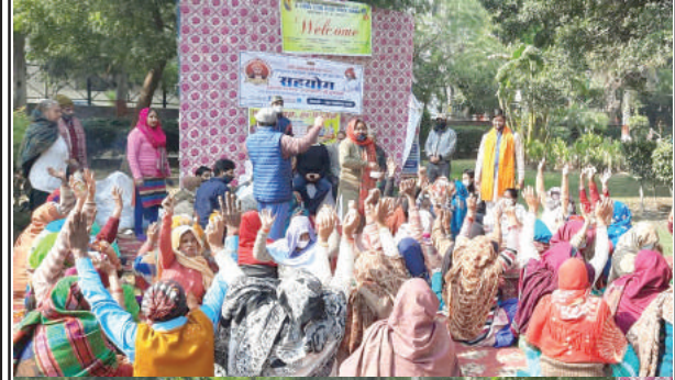
दयानन्द विहार पार्क, दयानन्द विहार, दिल्ली