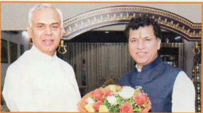
गांधीनगर, राजभवन में केन्द्रीय कृषि एवं किसान कल्याण राज्य मंत्री श्री कैलाश चौधरी जी का अभिनन्दन करते हुए राज्यपाल आचार्य श्री देवव्रत जी