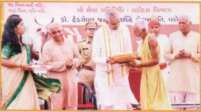
गो सेवा गतिविधि द्वारा वडोदरा के बाणज गांव में गो कृषि संगम में प्रगतिशील किसान को पुरस्कृत करते हुए राज्यपाल आचार्य श्री देवव्रत जी