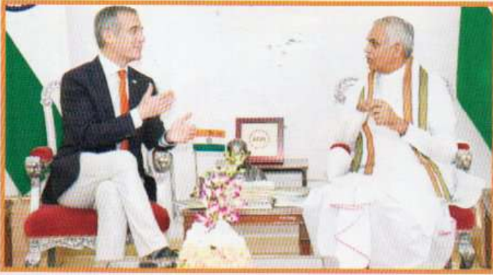
भारत में अमेरिका के राजदूत श्री एरिक गार्सेटी से गांधीनगर स्थित राजभवन में औपचारिक भेंट करते हुए राज्यपाल आचार्य श्री देवव्रत जी