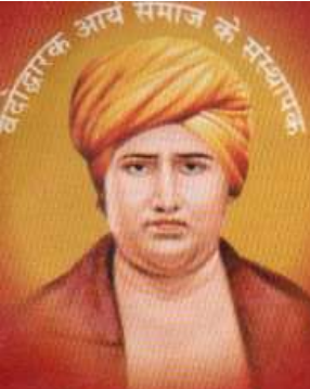
स्वामी दयानन्द सरस्वती