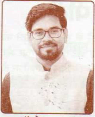
डॉ. देव आनन्द