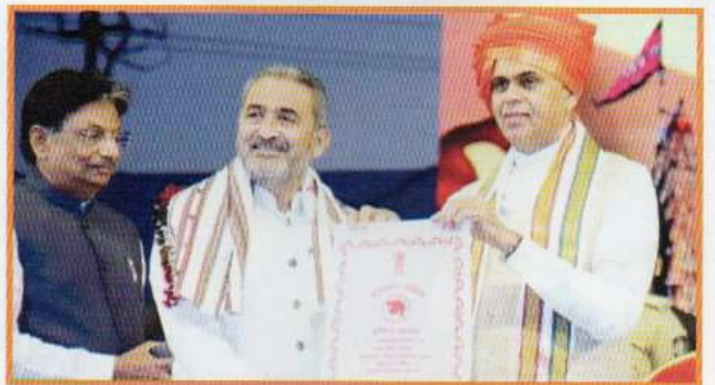
गुजरात के 63वें स्थापना दिवस पर राज्य स्तरीय समारोह में विशिष्ट अतिथियों को सम्मानित करते हुए राज्यपाल आचार्य श्री देवव्रत जी