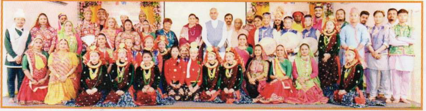
सिक्किम राज्य के 48वें स्थापना दिवस पर राजभवन गुजरात में भव्य समारोह का आयोजन हुआ, समारोह के उपरान्त कलाकारों के साथ सामूहिक छायाचित्र में राज्यपाल आचार्य श्री देवव्रत जी, लेडी गवर्नर श्रीमती दर्शना देवी जी व अन्य अधिकारीगण।