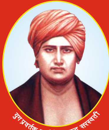
आधुनिक महर्षि दयानन्द सरस्वती