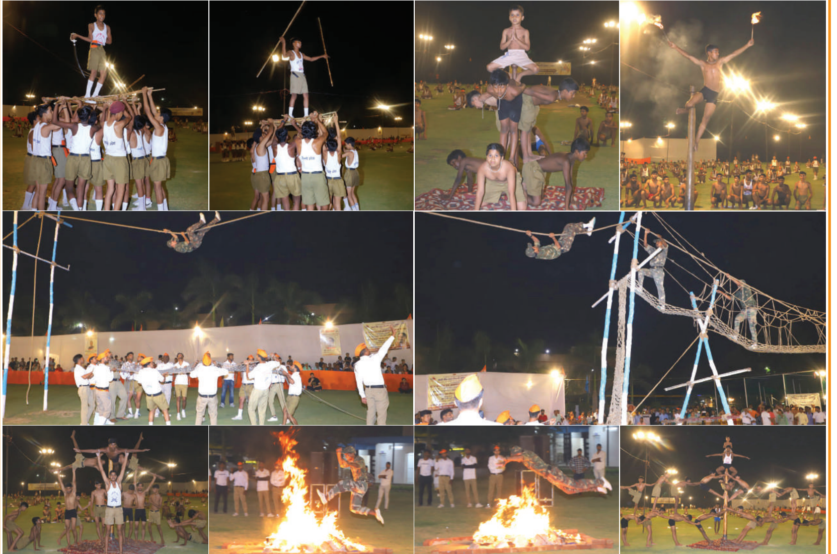
समापन समारोह के अवसर पर भव्य व्यायाम प्रदर्शन के विभिन्न आयामों को प्रस्तुत करते हुए आर्यवीर, जिनमें लाठी, भाला, तलवार, मलखम, कर्मांडो, जूडो-कराटे आदि का प्रदर्शन इतना प्रभावशाली सिद्ध हुआ कि उपस्थित जनसमूह रोमांचित और भावविभोर हो उठा।