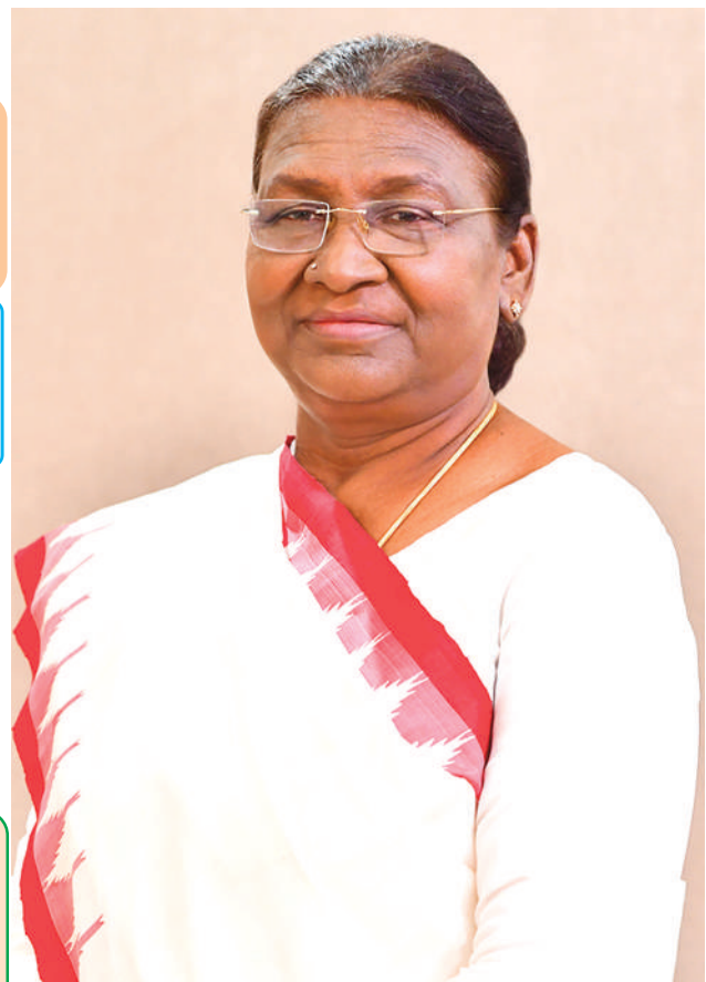
- अन्य सम्बन्धित जानकारी एवं सूचनाएं पृष्ठ 4-5 एवं 7-8 पर

200वीं जयन्ती के स्मरणोत्सव को सफल बनाने में अहम् भूमिका निभाएं : समस्त आर्यजन, आर्यसमाजें एवं संस्थान आर्थिक रूप से अपनी कुछ-न-कुछ आहुति अवश्य ही प्रदान करके सहयोग करें।