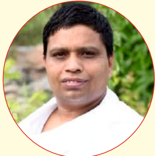
विशिष्ट अतिथि आचार्य बालकृष्ण जी