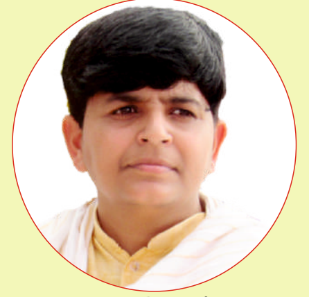
बहन प्रवेश आर्या