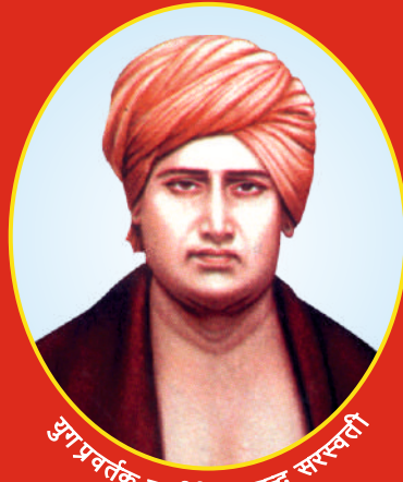
ॐ प्रवर्तक महर्षि दयानन्द सरस्वती