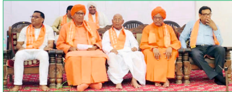
पृष्ठ 1 का शेष