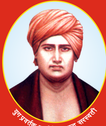
युग प्रवर्तक महर्षि दयानन्द सरस्वती