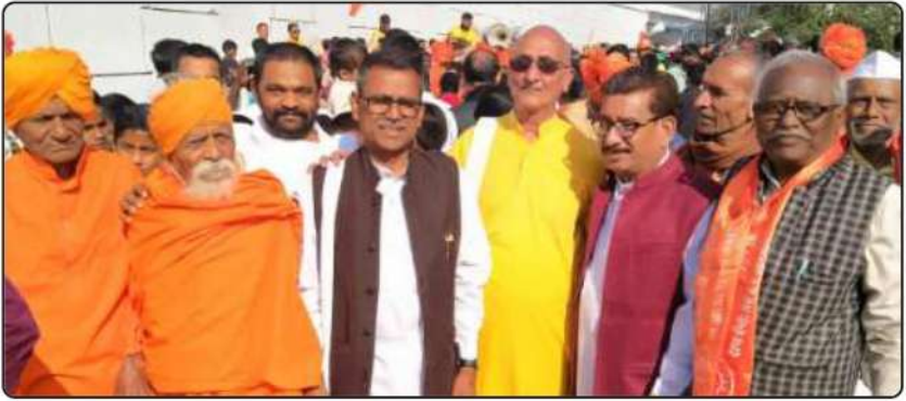
टंकारा में आयोजित अन्तर्राष्ट्रीय महर्षि दयानन्द द्विजन्मशताब्दी समारोह में सम्मिलित महाराष्ट्र के मुनिजन, सभा के पदाधिकारी एवं आर्य कार्यकर्ता।