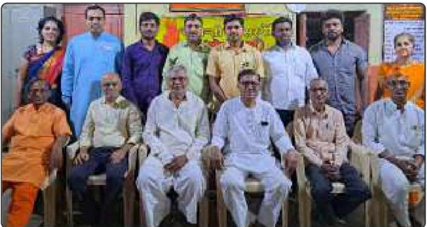
सोलापुर आर्य समाज के नवनिर्वाचित पदाधिकारी गण।