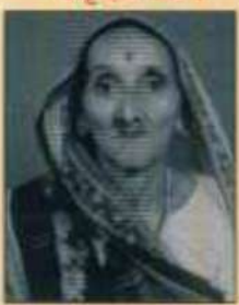
भावभीनी अद्वैतान्जलि ।