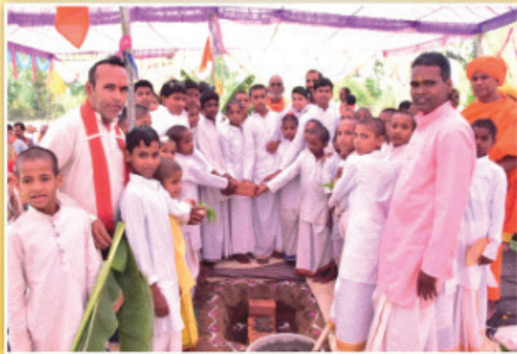
परोपकारिणी सभा के अंतर्गत संचालित गुरुकुल जमानी आश्रम मातृश्री काशीबा हरि भाई गोठी चैरिटेबल ट्रस्ट कर्मयोगी परिवार सूरत की ओर से नए भवन का निर्माण शुरु। इस मौके पर आयोजित यज्ञ आदि के कार्यक्रम में ट्रस्ट के कई पदाधिकारी भी उपस्थित थे।