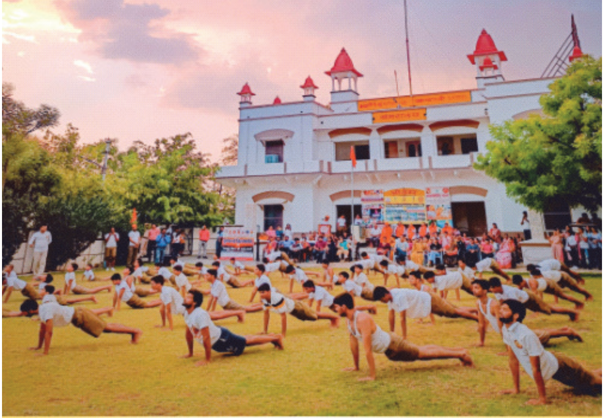
परोपकारिणी सभा व आर्यवीर दल अजमेर के संयुक्त तत्वाधान में आयोजित शिविर के समापन समारोह का दृश्य