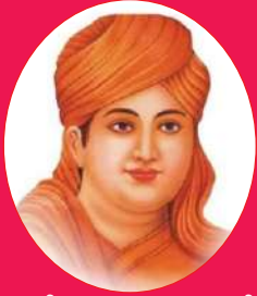
स्वामी दयानन्द सरस्वती

Email : aryasamajmarathalli@yahoo.co.in www.bangalorearyasamaj.com