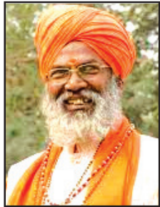
श्री साक्षीमहाराजः उन्नाव (उ.प्र.)