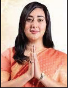
श्री सुश्री बाँसुरीस्वराजः देहलीप्रान्तः

अष्टादशम्यां लोकसभायां देशस्य द्वाविंशद्भिः नवनिर्वाचितैः संस्कृतानुरगिभिः सांसदैः भारतस्य आत्मभूतायां संस्कृतभाषायां शपथं गृहीत्वा आत्मानं, भारतं, संस्कृतं च गौरवन्वितं विहितम्। एतादृशानां सर्वेषामपि माननीयानां 'संस्कृतसंवाद'स्य हार्दिकं अभिनन्दनम्।