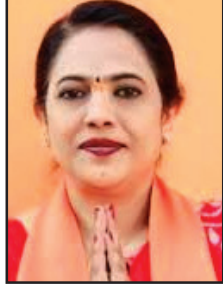
श्रीमती लतावानखेडे सागरः (म.प्र.)