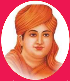
स्वामी दयानन्द सरस्वती

Email : aryasamajmarathalli@yahoo.co.in www.bangalorearyasamaj.com