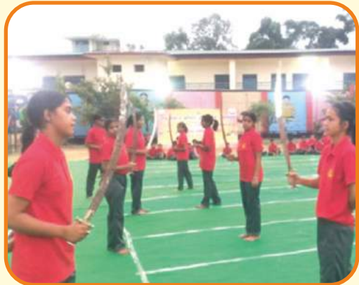
श्री श्रद्धानन्द बाल वनिता आश्रम में संस्कार शाला शिविर का समापन समारोह