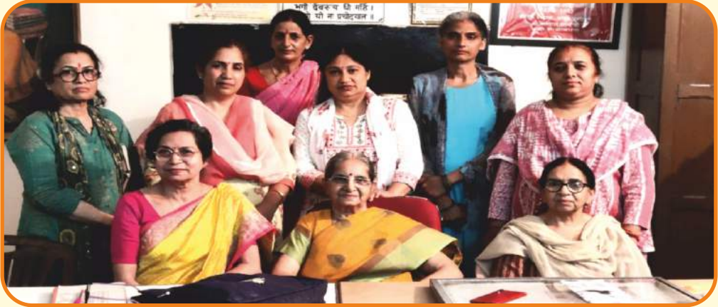
स्त्री आर्य समाज करणपुर की नई कार्यकारिणी