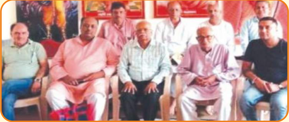
आर्य समाज मन्दिर करणपुर की कार्यकारिणी