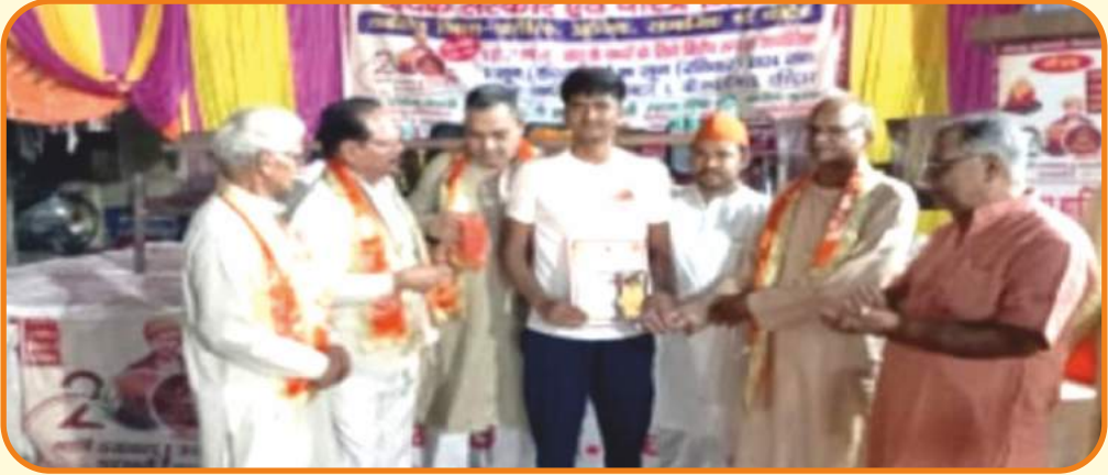
आर्य समाज बी.एच.ई.एल. में वैदिक संस्कार चरित्र निर्माण शिविर