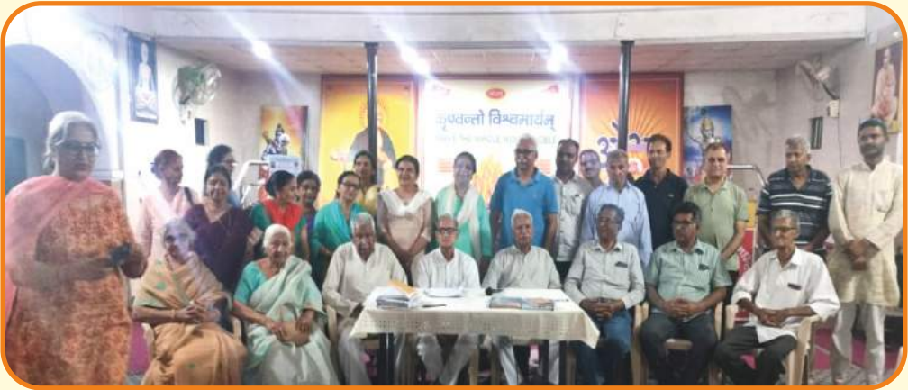
आर्य समाज मन्दिर विकासनगर की कार्यकारिणी