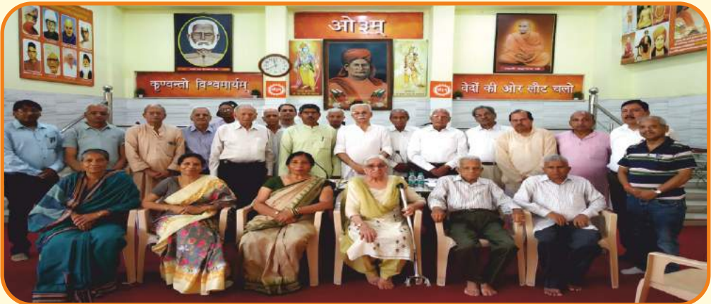
आर्य समाज मन्दिर धामावाला देहरादून के 146 वें वार्षिक सत्र 2024-25 के लिए नव निर्वाचित पदाधिकारी एवं अंतरंग सदस्य