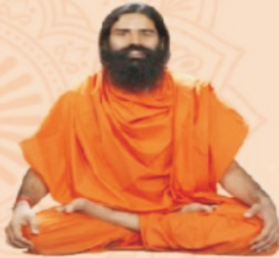
विशेष उपस्थिति स्वामी रामदेव जी