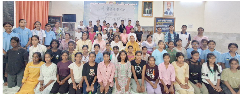
आर्य वीरांगना दल दिल्ली प्रदेश की आर्य वीरांगनाओं की कार्यशाला बैठक