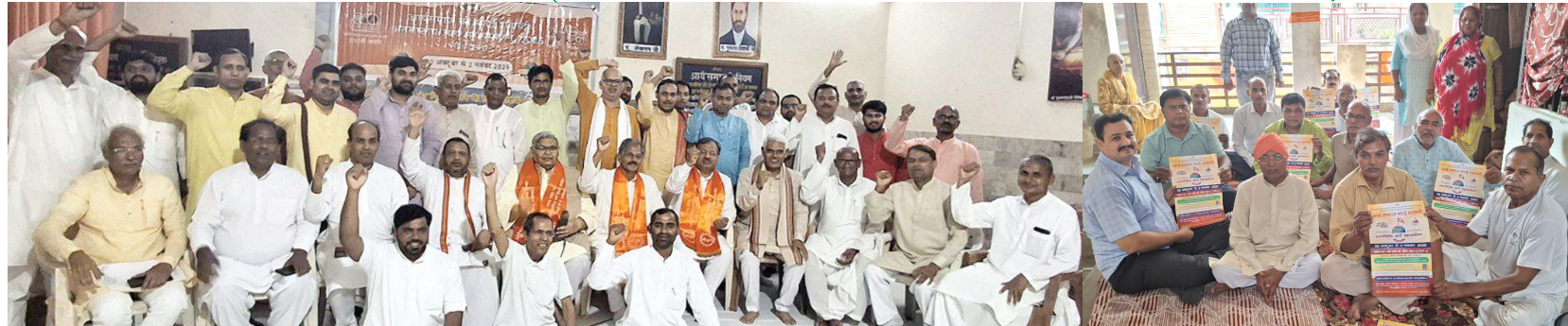
आर्यसमाज बिडला लाइन्स में आर्य पुरोहित सभा द्वारा दिल्ली आर्यसमाज के पुरोहितों की बैठक