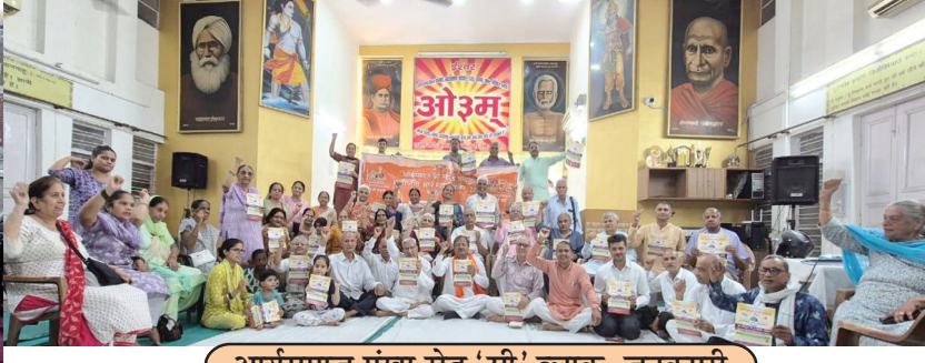
आर्यसमाज पंचा रोड 'सी' ब्लाक, जनकपुरी