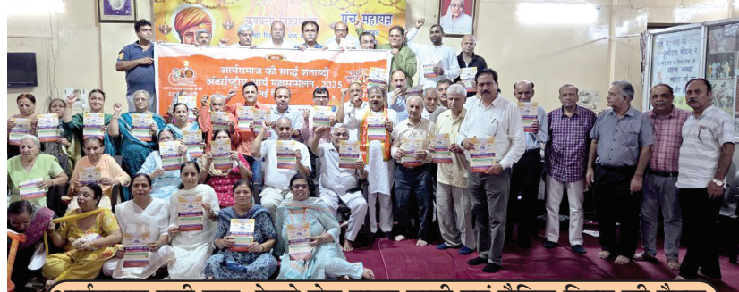
आर्यसमाज रानी बाग, रेलवे रोड शकूर बस्ती एवं सैनिक विहार की बैठक