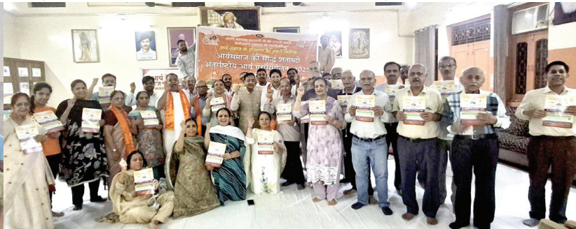
आर्यसमाज विवेक विहार, झिलमिल कालोनी, आनन्द विहार एवं दयानन्द विहार की बैठक