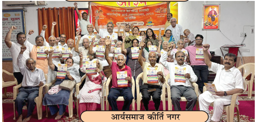
आर्यसमाज कीर्ति नगर