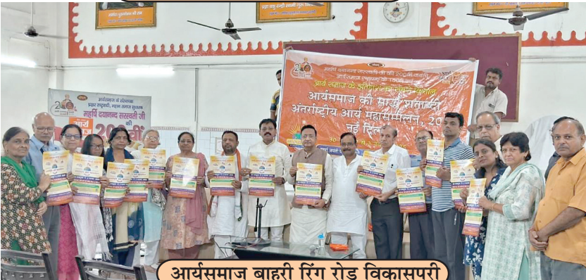
आर्यसमाज बाहरी रिंग रोड विकासपुरी