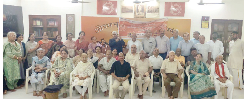
आर्यसमाज ग्रीन पार्क