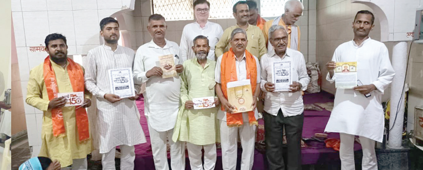
आर्यसमाज मोहन गार्डन, उत्तम नगर