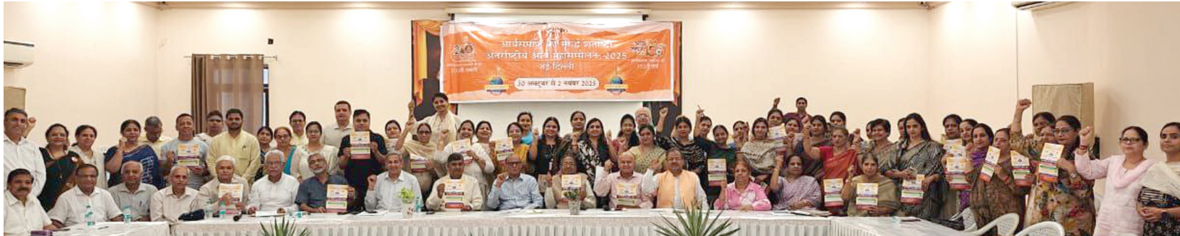
आर्यसमाज पंजाबी बाग पश्चिम में आर्य विद्या परिषद् दिल्ली के अन्तर्गत दिल्ली के आर्य विद्यालयों के अधिकारियों, प्रधानाचार्यों एवं अध्यापकों की बैठक

तैयारियों हेतु दिल्ली की आर्यसमाजों में निरन्तर जारी हैं, जन सम्पर्क महा अभियान बैठकें