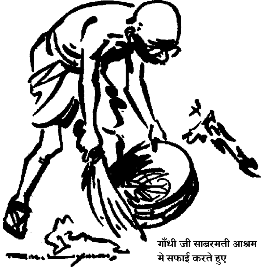
गाँधी जी साबरमती आश्रम मे सफाई करते हुए

इस के ठीक 13 साल बाद फिर महात्मा गान्धी को बनारस जाने का अवसर मिला। उन्हें बनारस हिन्दु विश्वविद्यालय के उदघाटन समारोह में बुलाया हुआ था। कई राजा महाराजा और कांग्रेसी नेता वहां मौजूद थे। पर गांधी जी को उस समय अधिक लोग न तो जानते थे और न ही भारतीय रातनीती में उनका वह सर्वोच्च स्थान था जो कि बाद में बना। गांधी जी उस