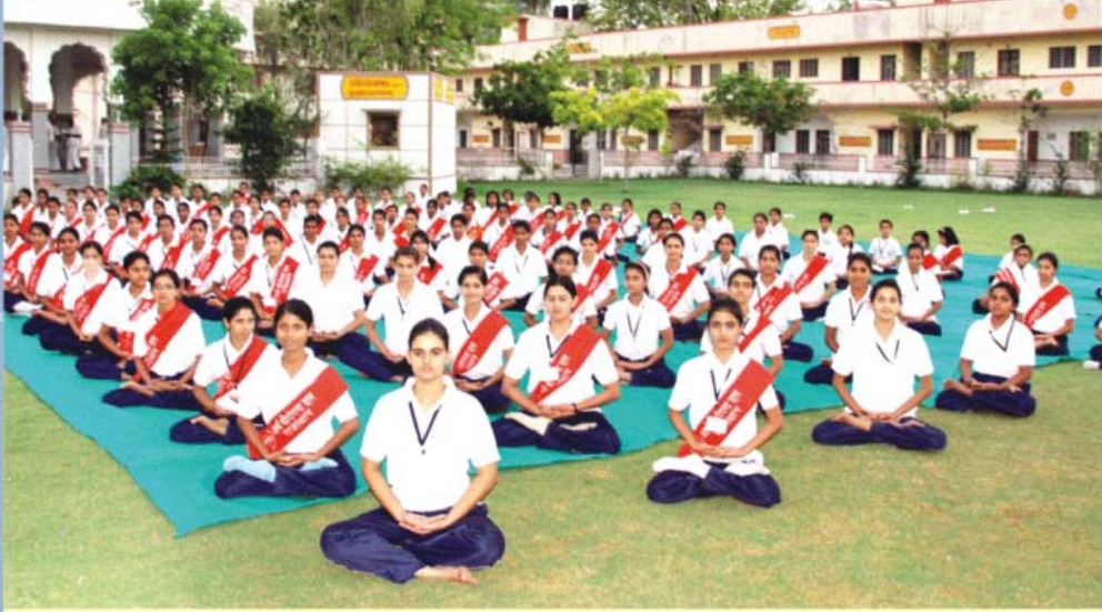
आर्यवीरांगना दल शिविर ( १ से ८ जून २०१४ ) ऋषि उद्यान, अजमेर