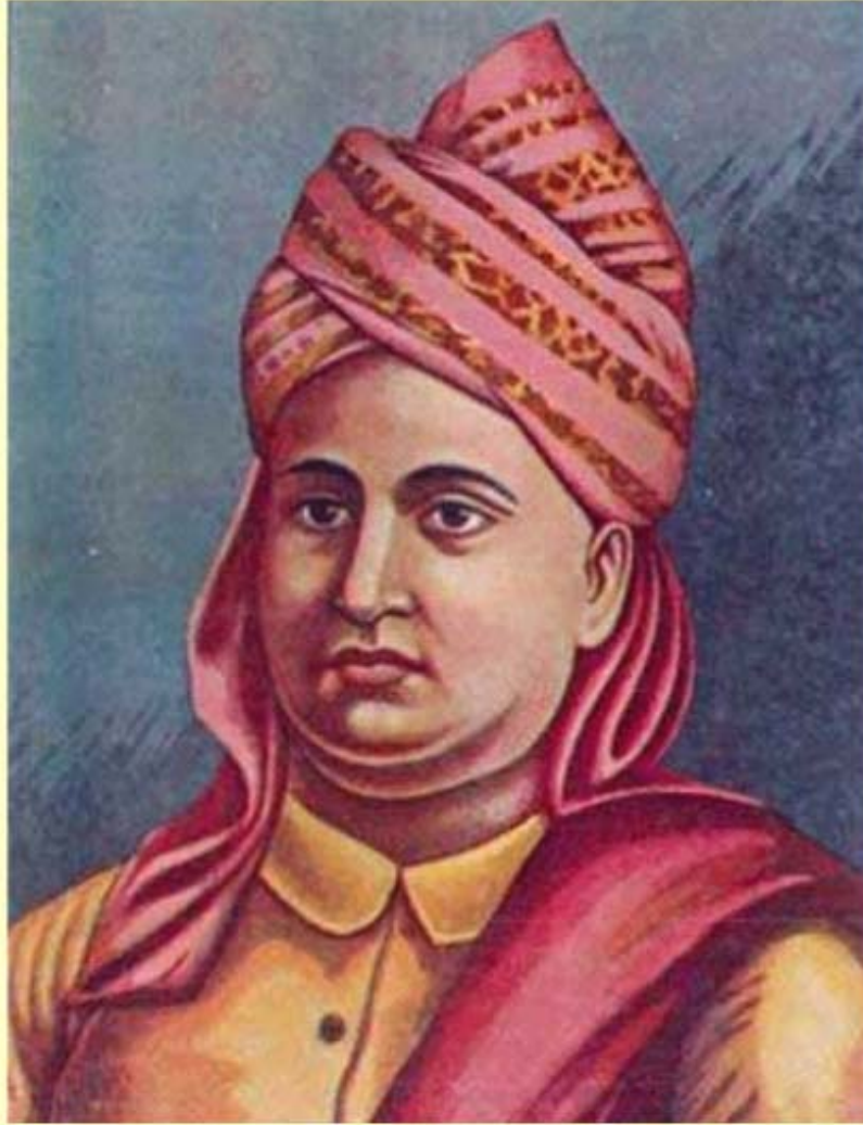
महर्षि दयानन्द सरस्वती

वर्ष - ५६ अंक - १३ महर्षि दयानन्द की स्थानापन्न परोपकारिणी सभा का मुखपत्र जुलाई ( प्रथम ) २०१४