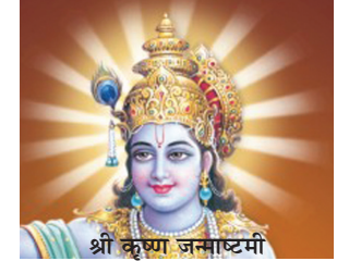
श्री कृष्ण जन्माष्टमी

5. क्षेत्रीय जनता जैसे उच्च पुलिस अधिकारी, सैन्य बलों के अधिकारी, विभिन्न विषयों के विशेषज्ञ जैसे डॉक्टर, वकील, इंजीनियर इत्यादि तथा विशेष रूप से छात्र वर्ग को आर्यसमाज तथा स्वामी दयानन्द के विचारों से परिचित कराने हेतु अल्पमूल्य का लघु साहित्य वितरित करें। इस हेतु सभा से 'एक निमन्त्रण', आर्यसमाज के स्वर्णिम सूत्र' एवं 'लघु (बाल) सत्यार्थ प्रकाश' उपलब्ध है। आप इन्हें क्रय करके वितरित कर सकते हैं।