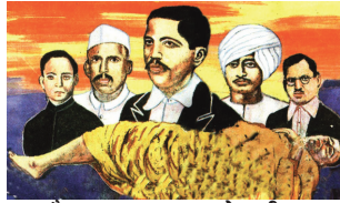
हैदराबाद सत्याग्रह के शहीद

पारम्परिक रूप में औपचारिकता पूर्ण हेतु मनाने से कोई विशेष लाभ नहीं होता। यदि वेद प्रचार समारोह को उत्साहपूर्वक अधिकाधिक लोगों को सम्मिलित करके मनाया जाए तो ज्ञान गंगा घर-घर में पहुंचाई