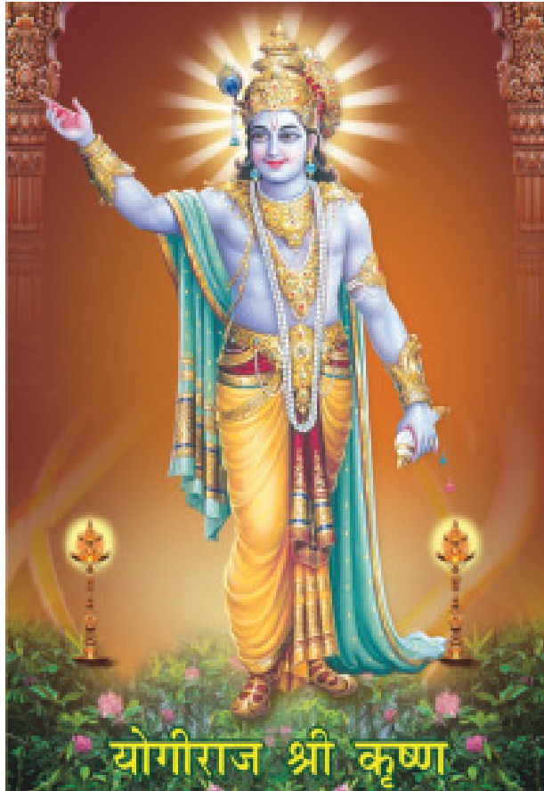
योगीराज श्री कृष्ण

सार्वदेशिक आर्य प्रतिनिधि सभा की तीन दिवसीय कार्यकर्ता गोष्ठी एवं साधारण सभा बैठक तिथियों में परिवर्तन