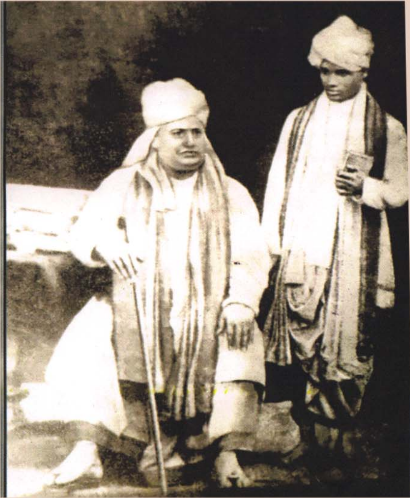
महर्षि दयानन्द सरस्वती

वर्ष - ५६ अंक - २२ महर्षि दयानन्द की स्थानापन्न परोपकारिणी सभा का मुखपत्र नवम्बर (द्वितीय) २०१४