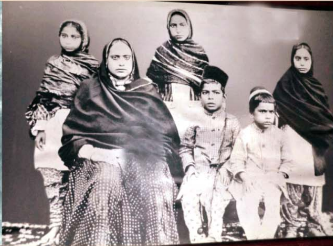
स्वामी श्रद्धानन्द के परिवार का चित्र