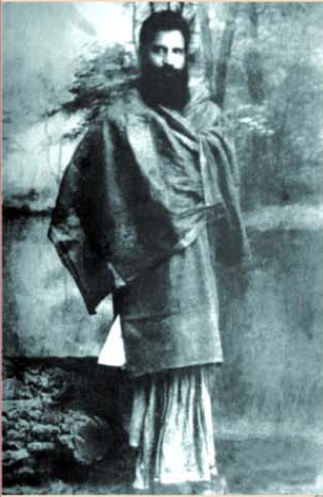
संन्यास पूर्व स्वामी श्रद्धानन्द