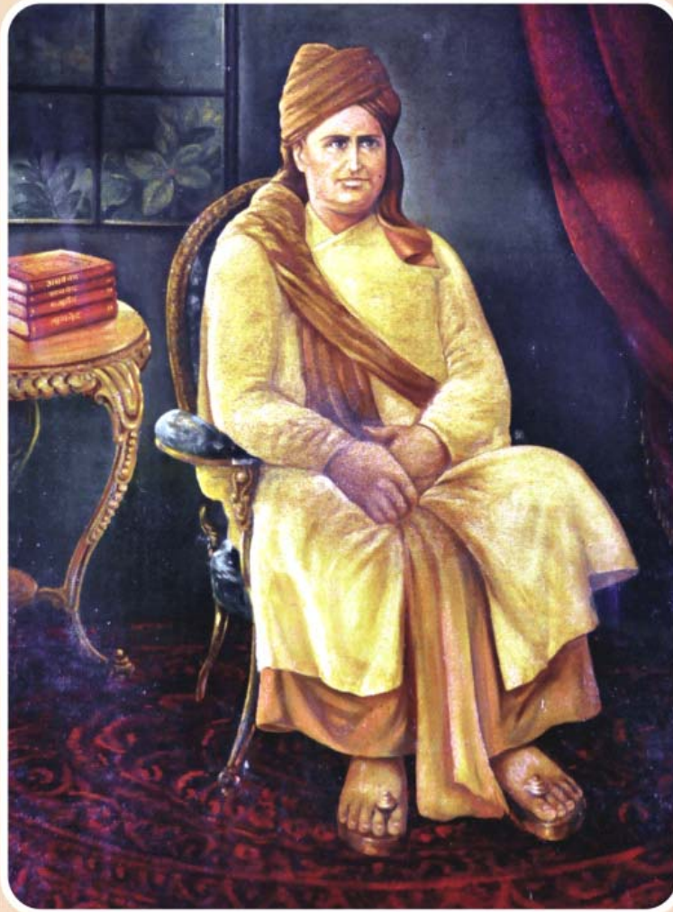
महर्षि दयानन्द सरस्वती

वर्ष - ५६ अंक - २४ महर्षि दयानन्द की स्थानापन्न परोपकारिणी सभा का मुखपत्र दिसम्बर (द्वितीय) २०१४