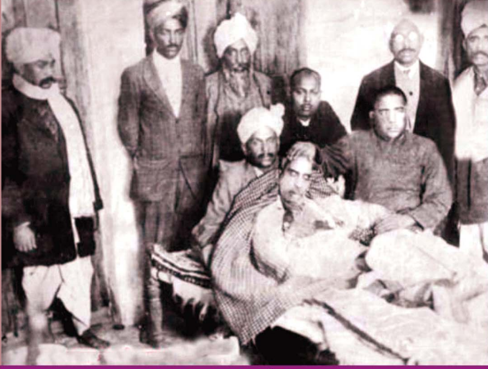
मृत्यु शय्या पर स्वामी श्रद्धानन्द