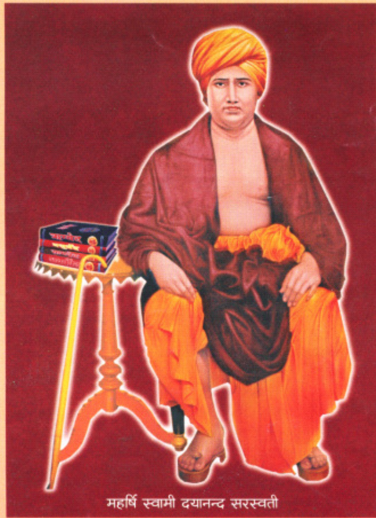
महर्षि स्वामी दयानन्द सरस्वती