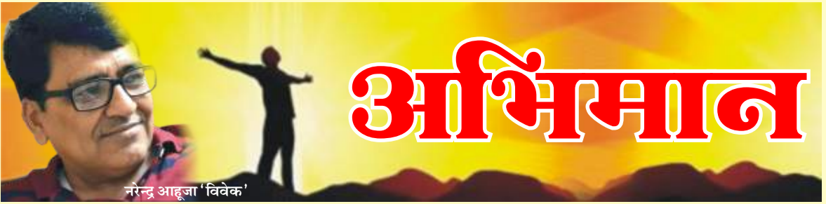
नरेन्द्र आहूजा 'विवेक'