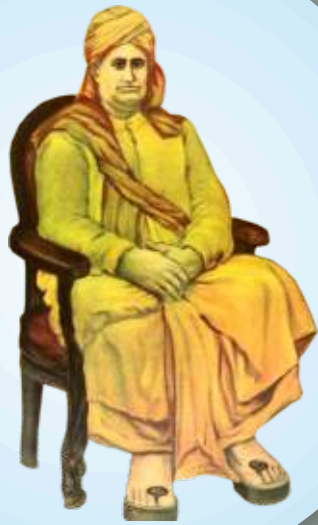
महर्षि ज्योतिरामदास फुले