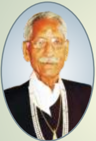
कर्मयोगी महाशय धर्मपाल अध्यक्ष - न्यास

पुण्यकर्म से जग यश गाता, पावन होता मनो पुण्यकर्म के बल पर ही, जगमग होता जीवन॥