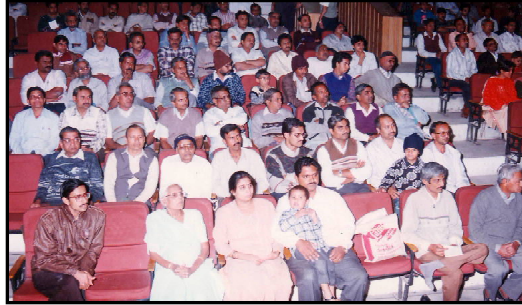
સમાચારોને યોગ્ય સ્થાન આપતા કોઈ સમાચારપત્ર ચાલતું ન હતું. પ્રાંતીય સભા દ્વારા પણ આવા સમયે વૈદિક

ધર્મો એકબીજાના સંપર્કમાં રહી શકે, આર્યજગતની ગતિવિધિઓથી સૌ માહિતગાર બને અને દર્શન યોગ મહાવિદ્યાલય-રોજડ તથા આર્યસમાજોનાં કાર્યક્રમોથી લોકોને માહિતગાર કરવાના આશયથી આ સમાચાર પત્રનો પ્રારંભ કરવામાં આવ્યો હતો. આર્યસમાજો તથા આર્યસમાજોની સંખ્યા બહુ